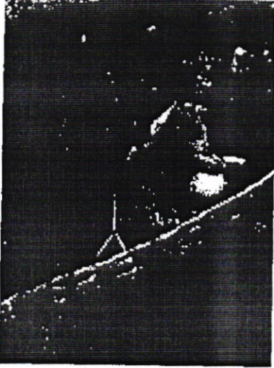
Şekil 1. Yemen'de kovaşına değişik kaynaklardan su toplamaya çalışan bir çocuk

Dünyada halen insan onuruna yakışır biçimde içme suyuna ve sanitasyona erişemeyen insanlar bulunmaktadır. Yaklaşık 750 milyon kişi içme suyuna erişememekte, her gün 1000 çocuk kirli su, sanitasyon ya da hijyen yetersizliklerine bağlı hastalıklar yüzünden ölmektedir. Yemen'de kovaşını değişik su birikintilerinden topladığı sularla doldurmaya çalışan bir çocuğun fotoğrafı bu yılın teması ile ilişkilendirilerek kullanılan en dikkat çekici görüntüsü olmuştur.